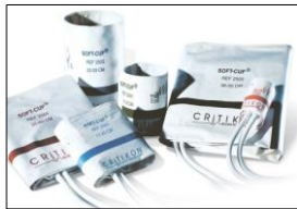
SOFT-CUF Erwachsene . VE:20 SFT-A2-2A weiß/marineblau, 23-33 cm SFT-A3-2A weiß/rosa, 31-40 cm