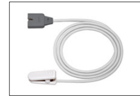
2027261-001 Masimo LNCS wiederverwend- barer Ohrsensor TC-I , 1 m (Benötigt Stammkabel)