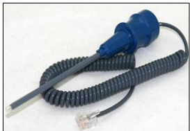
2008774-001 Turbo-Temp Temperatursensor für Oral-Messung, blau 2008775-001 für Rektal- Messung, rot