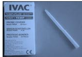
088015 Schutzhüllen, IVAC, Typ P850A, VE:5000