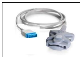
TS-SA4-GE TruSignal FingerTip Sensor, Erwachsene, durchgehend, 4 m