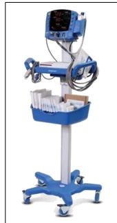
2073250-002 DINAMAP Rollständer 104 cm (Lieferung ohne Geräte und Carescape V100 Zubehör)

GE Healthcare GE Medical Systems Information Technologies GmbH Munzinger Straße 5 T: +49 (0)761 4543-601 F: +49 (0)761 4543-608