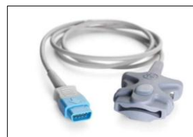
TS-SA-D TruSignal FingerTip Sensor, Erwachsene, 1 m TS-SP-D FingerTip Sensor, Kinder, 1 m (Benötigt Verbindungskabel)