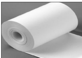
2009828-891 Thermo- Registrierpapier, VE:10 Rollen