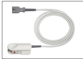
2027258-001 Masimo LNCS wiederverwend- barer Fingersensor DC-I , 1 m (Benötigt Stammkabel)