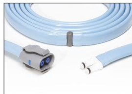
2058206-001 Blutdruckschlauch Neonatal Neo-Snap, 2-Schlauch, 3,6 m