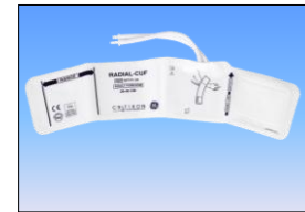
RADIAL-CUF Unterarmblutdruck- manschette für Adipositas Patienten, VE:20 SFT-F1-2A lila, Erwachsene