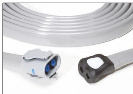
2058205-001 Blutdruckschlauch Erwachsene DINACLICK, 2-Schlauch, 3,6 m