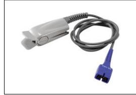
70124021 Nellcor DuraSensor, wiederverwend- barer Fingersensor DS100A , 1 m (Benötigt Stammkabel)