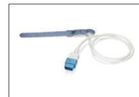
TS-AF-10 TruSignal Einweg-AllFit- Klebesensor, 0,5 m VE: 10 Stck. TS-AF-25 VE: 25 Stck. (Benötigt Verbindungskabel)