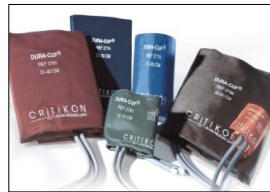
DURA-CUF Erwachsene , VE:1 DUR-A2-2A-E marineblau, 23-33 cm DUR-A3-2A-E weinrot, 31-40 cm