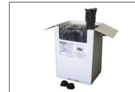
EX134203 Exergen Einweg- Kappen, schwarz, VE:1000 EX134205 Exergen Einweg- Kappen, Schwarz, VE:5000