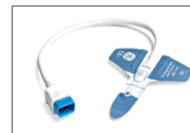
TS-AP-10 TruSignal Einwegklebesensor Erw/Kinder > 20Kg 0,3 m, VE: 10 Stck. TS-AP-25 VE: 25 Stck. (Benötigt Stammkabel)

Dies stellt nur eine Auswahl unserer GE TruSignal SpO2-Sensoren dar, weitere Varianten sind auf Anfrage erhältlich.