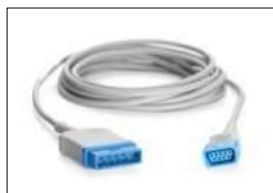
TS-G3 TruSignal Verbindungskabel 3m