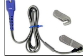
70124033 Nellcor Multiside Sensor D-YS , 1 m (Benötigt Stammkabel) 70124034 Nellcor SpO2 Ohrclip D-YSE f.d. Verwendung mit 70124033, 1 Stck.