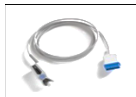
TS-F2-GE TruSignal Finger- Sensor mit GE Anschluss, durch- gehend, 2 m TS-F4-GE Sensor 4 m