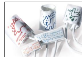
Neonatal Classic-CUF CLA-N1-2B 3-6cm CLA-N2-2B 4-8cm CLA-N3-2B 6-11cm CLA-N4-2B 7-13cm CLA-N5-2B 8-18cm Auch als Set Gr. 1-5 2059306-002 erhältlich