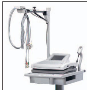
Trolley mit optionalem KISS Ausleger†