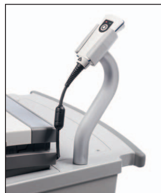
Neuer Barcodescannerhalter, geeignet für alte und neue Barcodescannermodelle